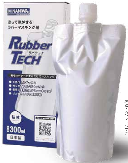
容器：スバウトパウチ